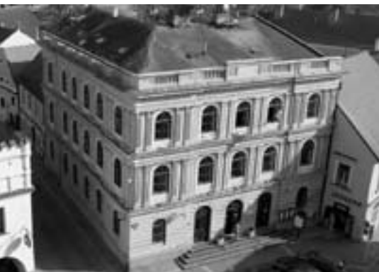
Budova současné radnice, čp 20/1

K prodeji nás vede skutečnost, že tyto domy město pro svoji činnost nepotřebuje a obava, že čp. 20, tj. současná radnice, dopadne jako vedlejší budova čp. 19, která chátrá mnoho let a je nyní v dezolátním stavu. Musím zdůraznit, že jsme prodej diskutovali jak ve vedení města, ve finančním výboru, a poté i na zastupitelstvu. Se smysluplným námětem, jak budovu využít pro potřeby města, nikdo nepřišel. Náзор, že bychom ji mohli pronajmout, naštěstí zastupitelé odmítli. Je zřejmé, že změna budovy pro jiný než kancelářský prostor, bude vyžadovat jisté investice a naše zkušenost s podobným záměrem ještě minulé