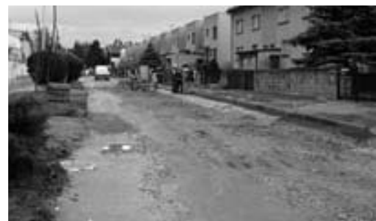
I. etapa rekonstrukce Lesní ulice